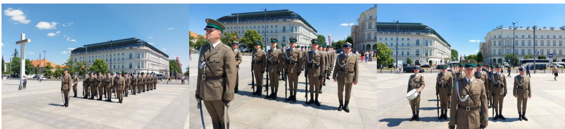
Uroczysta zmiana posterunku