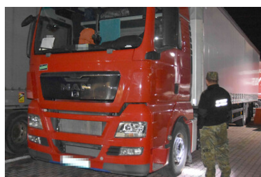
Funkcjonariusz SG sprawdza ciężarówkę