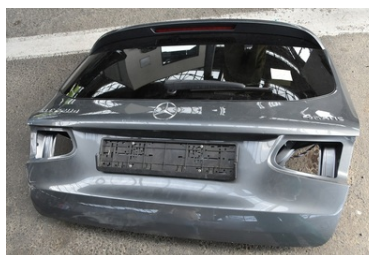
Zatrzymana część samochodowa