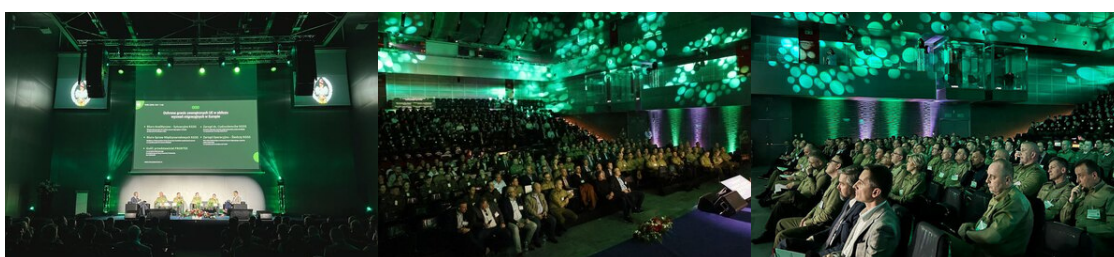
Konferencja Straży Granicznej w czasie II Międzynarodowych Targów POLSECURE w Kielcach