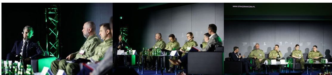
Prelegenci, moderator konferencji Straży Granicznej