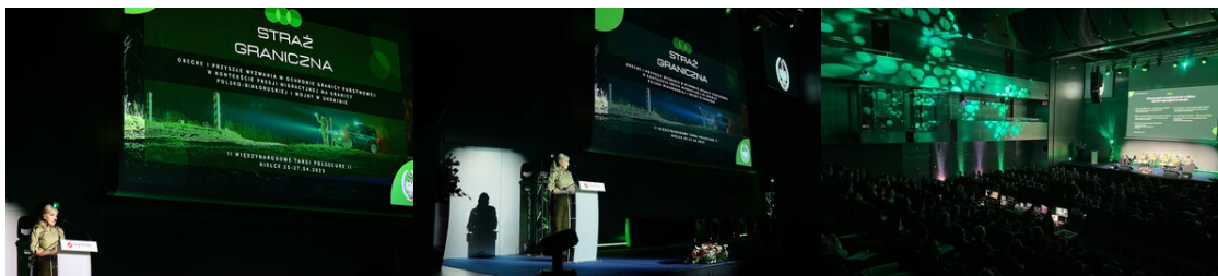
Gen. bryg. SG W. Gorzkowska Zastępca Komendanta Głównego SG w czasie rozpoczęcia Konferencji SG