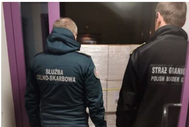
Funkcjonariusze w trakcie kontroli ciężarówki