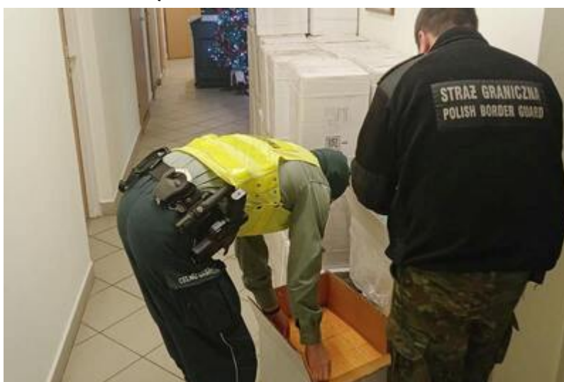
Funkcjonariusze zabezpieczają nielegalny towar