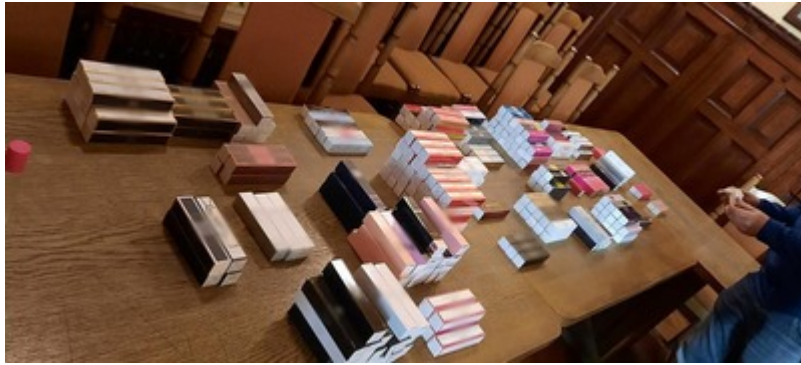
Ujawnoine podrobione perfumy i ubrania