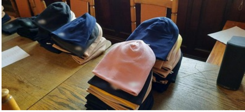
Ujawnoine podrobione perfumy i ubrania