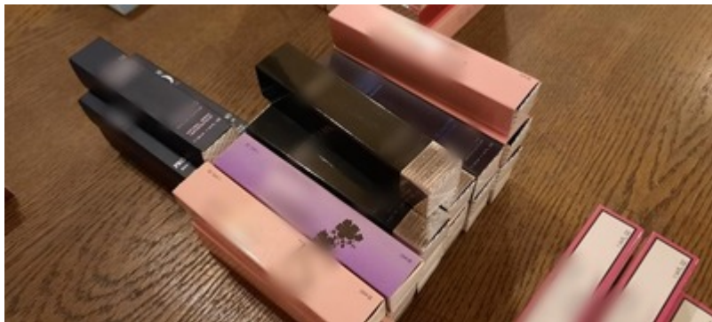
Ujawnoine podrobione perfumy i ubrania