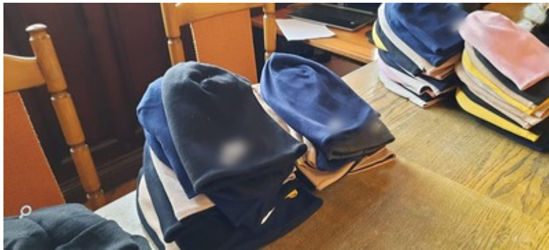
Ujawnoine podrobione perfumy i ubrania