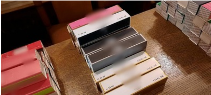
Ujawnoine podrobione perfumy i ubrania