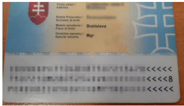
Podrobiony słowacki dowód osobisty