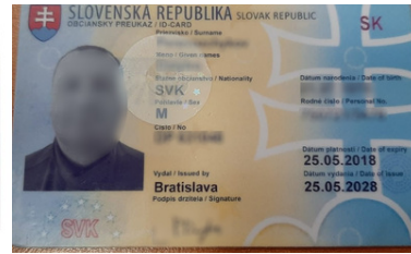
Podrobiony słowacki dowód osobisty