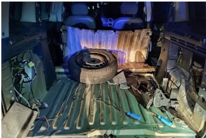
Narkotyki ujawnione przez funkcjonariuszy SG, CBŚP i KAS