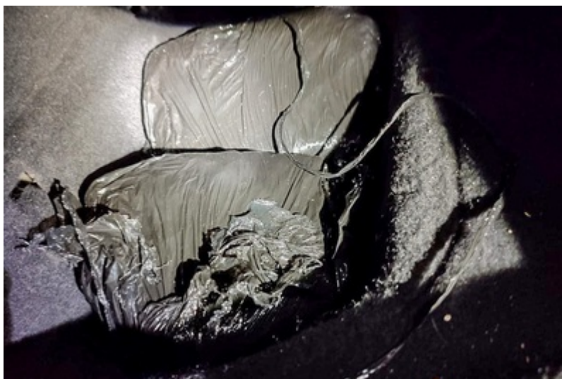
Narkotyki ujawnione przez funkcjonariuszy SG, CBŚP i KAS