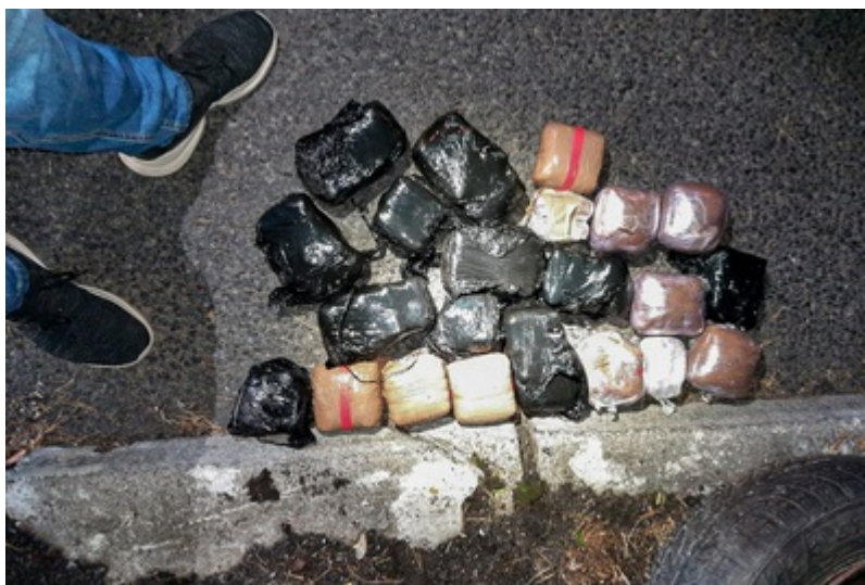
Narkotyki ujawnione przez funkcjonariuszy SG, CBŚP i KAS