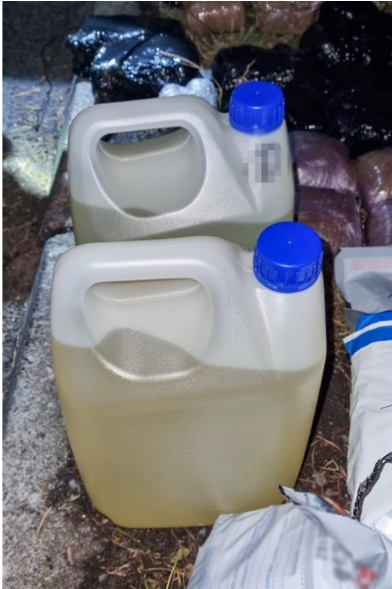
Narkotyki ujawnione przez funkcjonariuszy SG, CBŚP i KAS