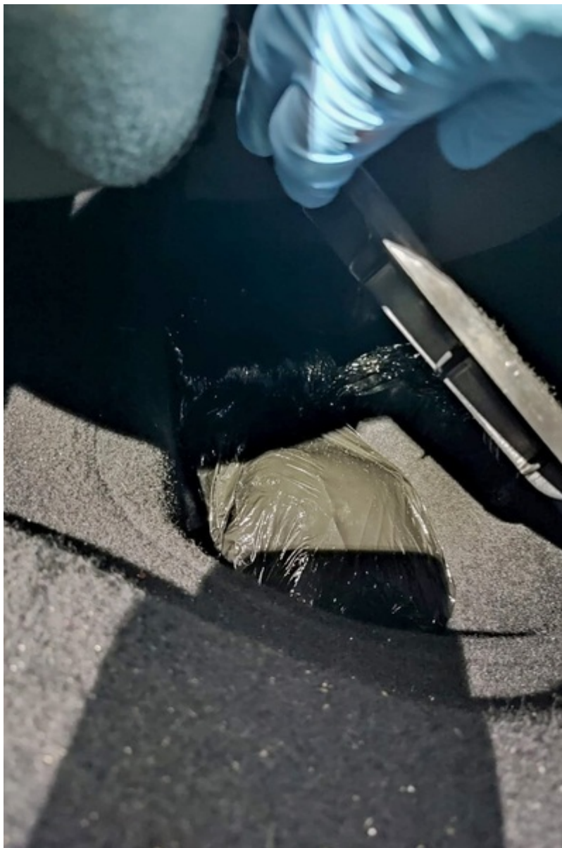
Narkotyki ujawnione przez funkcjonariuszy SG, CBŚP i KAS