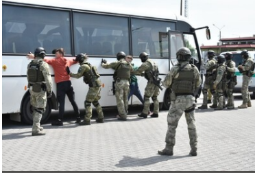
Ćwiczenia służb granicznych Grupy V4