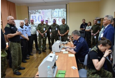
Ćwiczenia służb granicznych Grupy V4