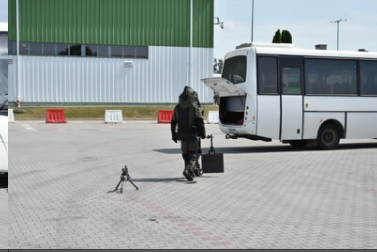
Ćwiczenia służb granicznych Grupy V4