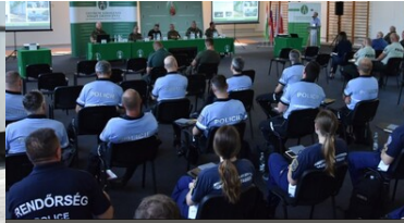
Ćwiczenia służb granicznych Grupy V4