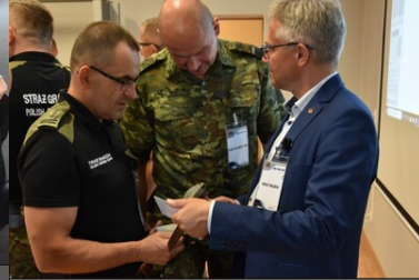
Ćwiczenia służb granicznych Grupy V4