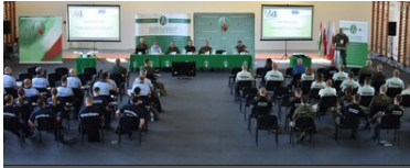
Ćwiczenia służb granicznych Grupy V4