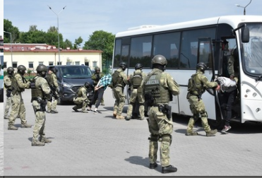
Ćwiczenia służb granicznych Grupy V4