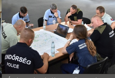
Ćwiczenia służb granicznych Grupy V4