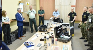
Ćwiczenia służb granicznych Grupy V4