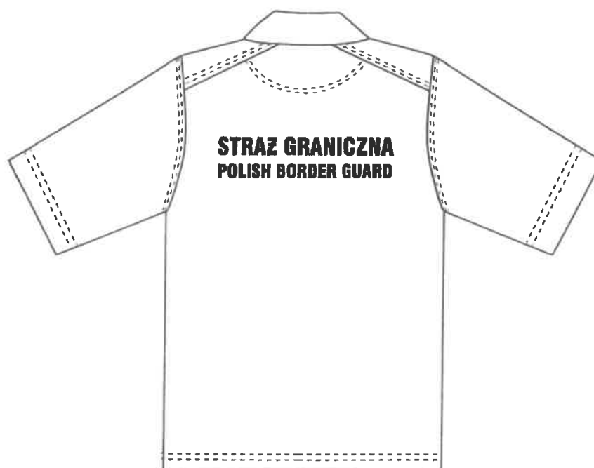
Rysunek 2. Koszulka „polo” – tył