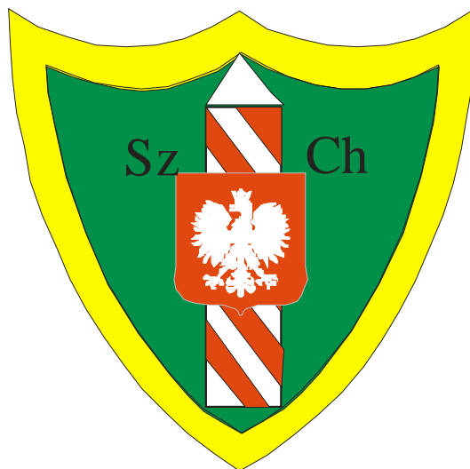
Identyfikator słuchaczy szkolenia w zakresie szkoły chorążych