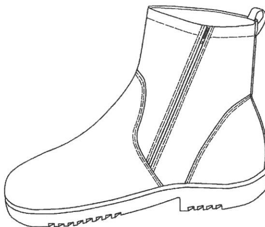
Rysunek 1 Półpara botków zimowych męskich