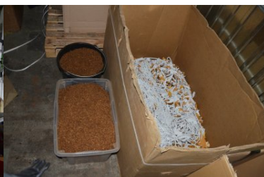
Zlikwidowano nielegalną wytwórnię papierosów