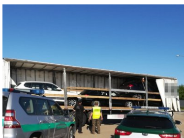
Trzy skradzione bmw w litewskim tirze