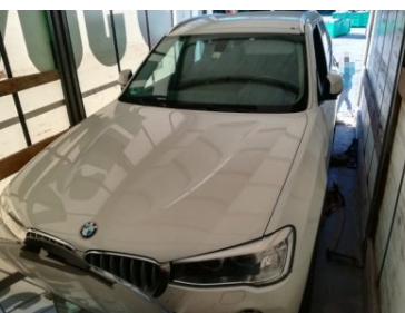
Trzy skradzione bmw w litewskim tirze