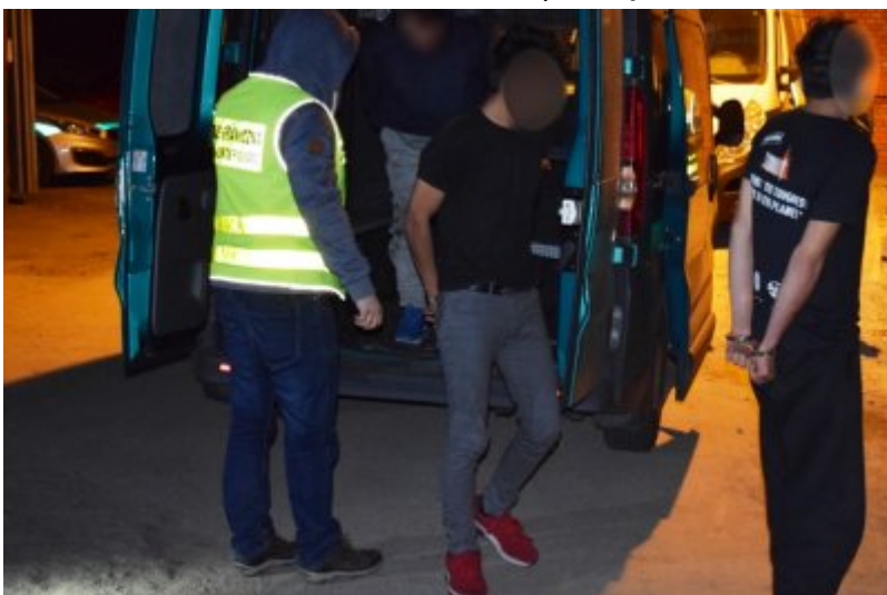
Afgańczycy ukryci w