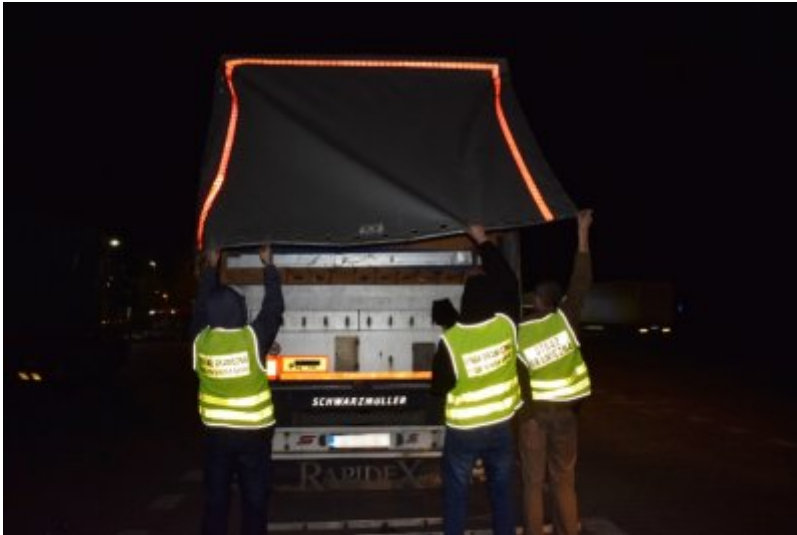
Afgańczycy ukryci w