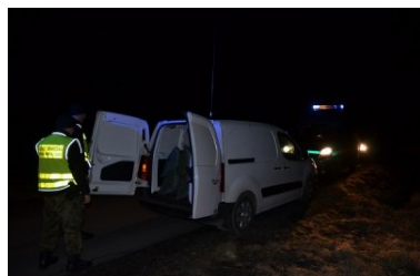
Straż Graniczna zlikwidowała nielegalną krajalnię tytoniu