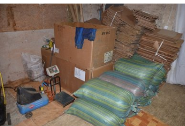
Straż Graniczna zlikwidowała nielegalną krajalnię tytoniu