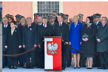
uroczystości z okazji święta Konstytucji 3 maja