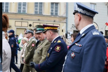
uroczystości z okazji święta Konstytucji 3 maja