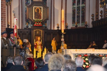
uroczystości z okazji święta Konstytucji 3 maja