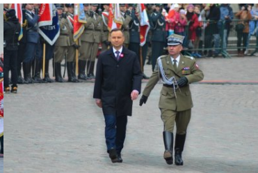
uroczystości z okazji święta Konstytucji 3 maja