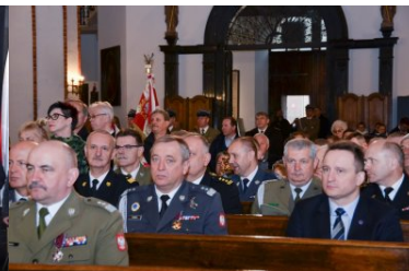
uroczystości z okazji święta Konstytucji 3 maja