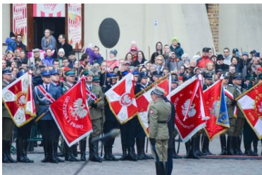
uroczystości z okazji święta Konstytucji 3 maja