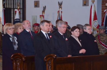
uroczystości z okazji święta Konstytucji 3 maja