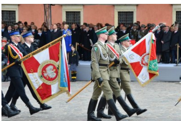
uroczystości z okazji święta Konstytucji 3 maja