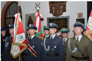
uroczystości z okazji święta Konstytucji 3 maja