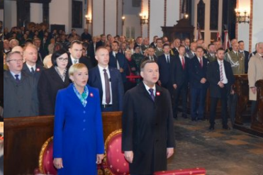
uroczystości z okazji święta Konstytucji 3 maja