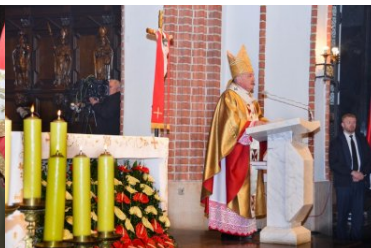
uroczystości z okazji święta Konstytucji 3 maja