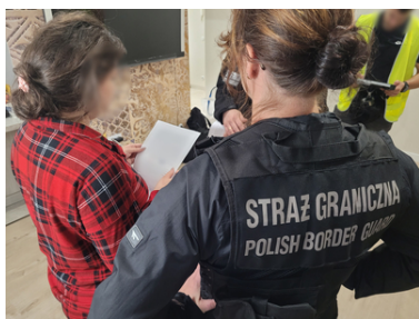
Ukraińsko-polska grupa przestępcza została rozbita