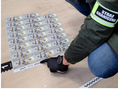
Ukraińsko-polska grupa przestępcza została rozbita