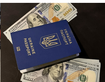
Ukraińsko-polska grupa przestępcza została rozbita