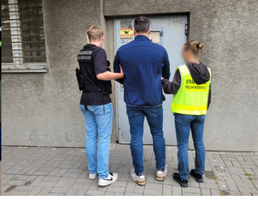
Ukraińsko-polska grupa przestępcza została rozbita