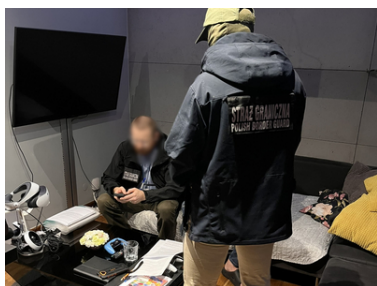
Ukraińsko-polska grupa przestępcza została rozbita