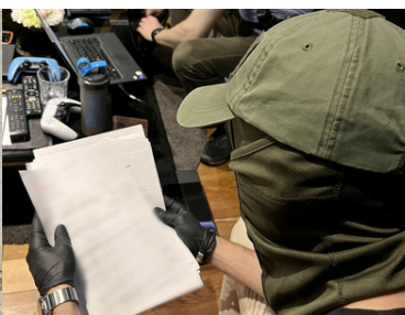
Ukraińsko-polska grupa przestępcza została rozbita