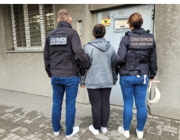
Ukraińsko-polska grupa przestępcza została rozbita